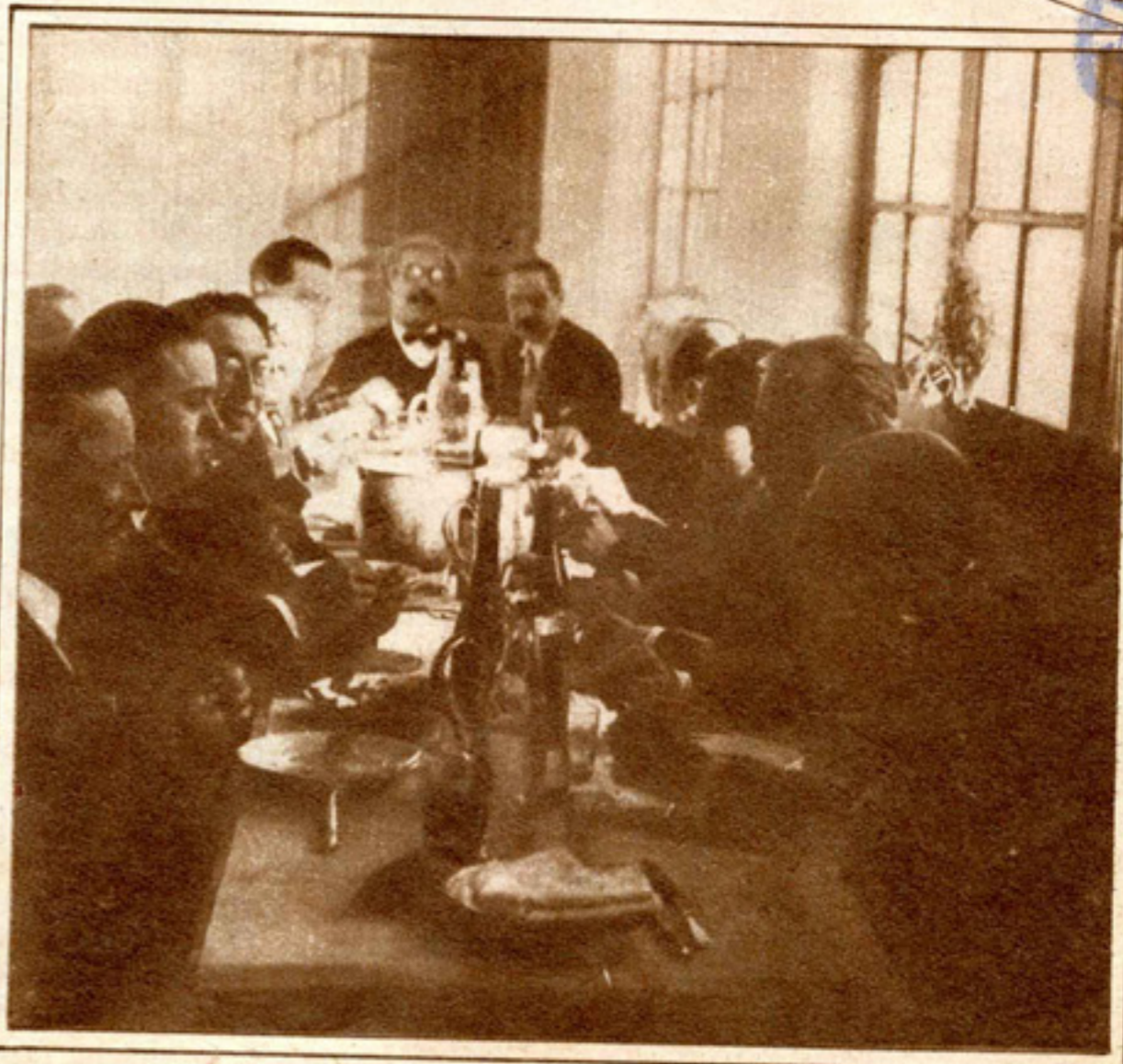
Una comida en la galería de presos políticos, en la que figuran como comensales muchos que hoy son personajes del régimen.