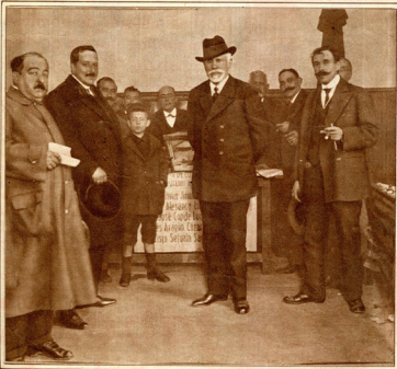
Pablo Iglesias, durante una de las propagandas electorales de la Conjunción republicano-socialista, a principios de siglo.

Hay un centro en España que ha gozado tradicionalmente de la libertad de su cátedra, aun en los tiempos de la más furiosa tiranía política: el Ateneo de Madrid. Allí se refugia el sentimiento de protesta con-