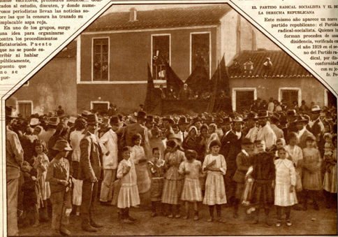
Paldo Iglesias en un mitin de propaganda en un pueblito andaluz.

Este mismo año aparece un nuevo partido republicano: el Partido radical-socialista. Quienes lo forman proceden de una disidencia, verificada en el año 1919 en el seno del Partido radical, por disconformidad con su jefe. Fe-