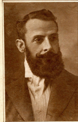
Jaime Vera que, con Paldo Iglesias, fue uno de los fundadores del Partido socialista español.

Ha transcurrido poco más de un año. Ha habido un serio intento revolucionario. Los republicanos tienen ya otra bandera más de lucha en los nombres de dos mártires de la causa, fusilados en diciembre. Corre el mes de marzo, cuando