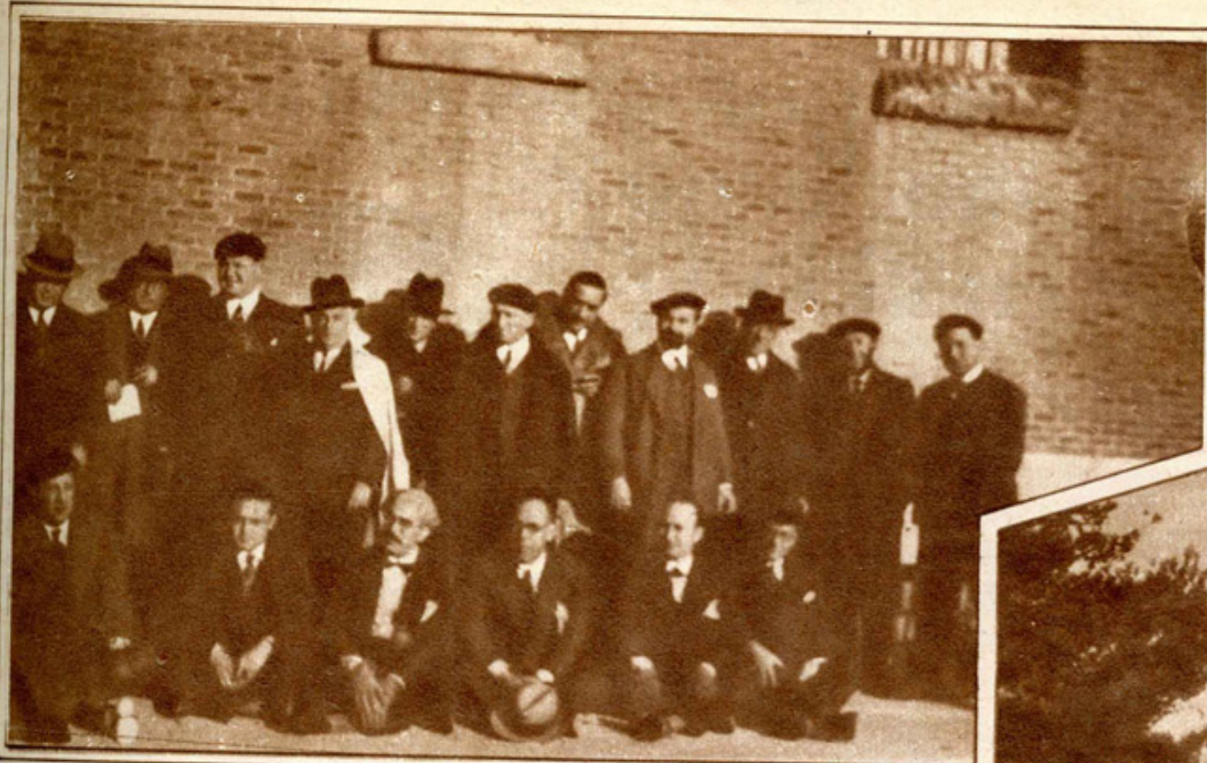
Grupo de detenidos, con motivo de la Revolución de diciembre de 1930, en un patio de la Cárcel Modelo.

varios jefes republicanos son sacados de la Cárcel Modelo de Madrid para comparecer ante el tribunal que ha de juzgarlos. Y se da el caso curioso de que estos hombres—convictos y confesos de los hechos de que se les acusa—se yerguen en el banquillo de los acusados, acusando, a su vez, al régimen que les enjuicia. Estos hombres son los representantes de los partidos nacidos en la lucha contra la Monarquía de la Restauración. ¡Y el público, que llena la sala—¡caso inaudito!—, los aplaude en plena sesión juzgadora del Consejo Supremo de Guerra y Marina!